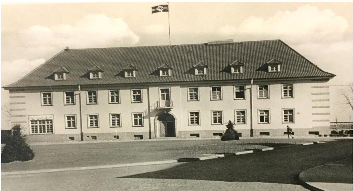
Regimentsgebäude 1938-1944.StAD, Ratsprotokoll v. 31.05.1937; Domsta/Krebs/Krobb, Zeittafel, S. 202.