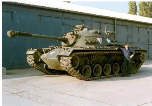
M48 hier in deutscher Version- trotz Hoheitszeichen der USA.