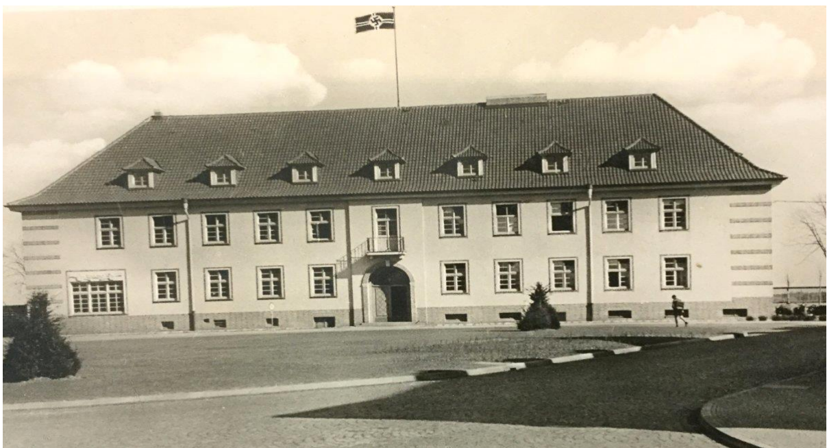
Regimentsgebäude 1938-1944.StAD, Ratsprotokoll v. 31.05.1937; Domsta/Krebs/Krobb, Zeittafel, S. 202.